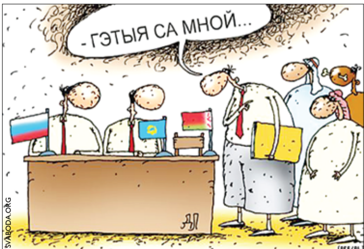
«Сірыя зацікаўленая ў прысутнасці на рынку Мытнага саюза Беларусі, Казахстана і Расіі», — заявіў прэзідэнт Сірыі Башар Асад падчас візіту ў Мінск.