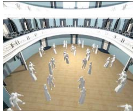
Зала стане мультыфункцыянальнай.