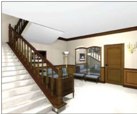
Гардэроб пераедзе ў сутарэнне.