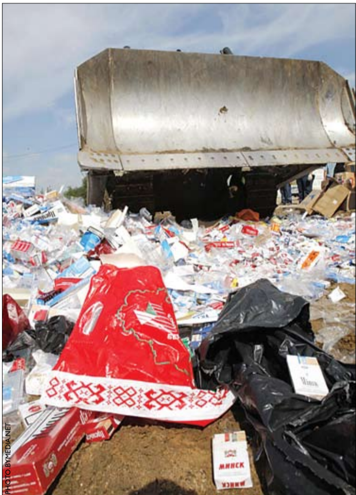
Падчас знішчэння кантрабандных цыгарэтаў на звалцы ля Мінска трапіла пад раздачу і дзяржсимволіка.