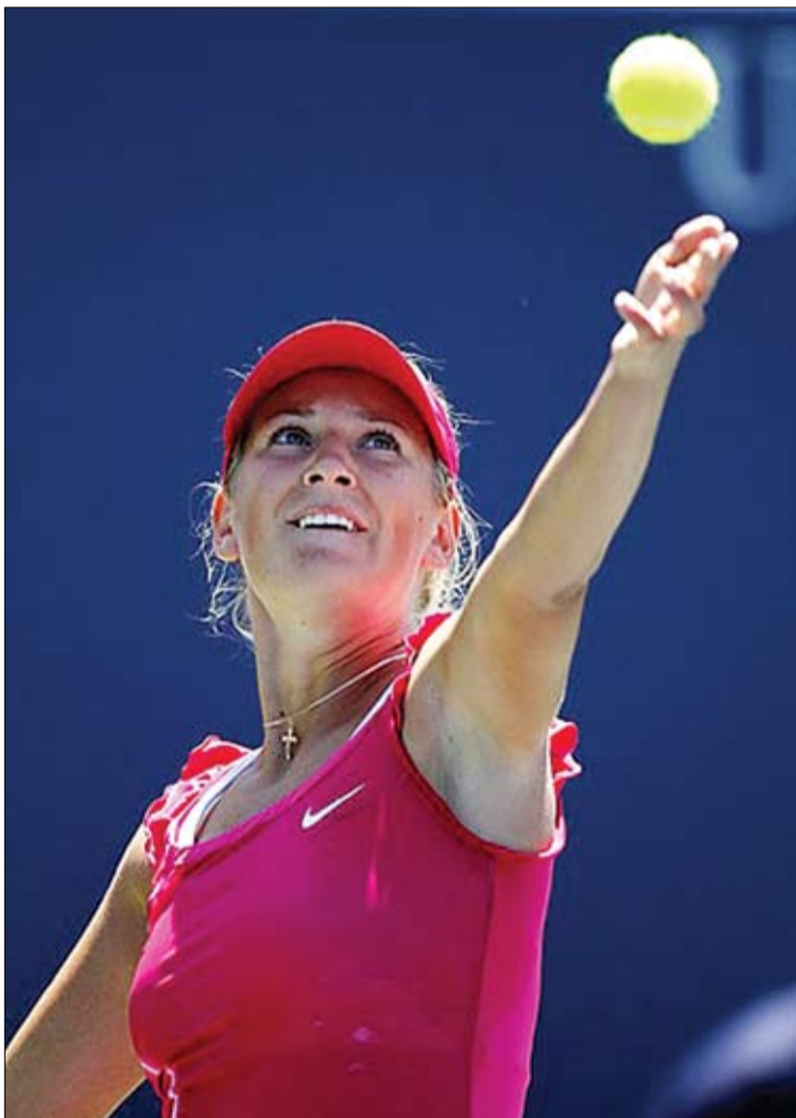
1 жніўня, у дзень свайго нараджэння, Вікторыя Азаранка выйграла турнір Сусветнай тэніснай асацыяцыі ў Стэнфардзе. У фінале яна перамагла расіянку Марыю Шарапаву — 6:4, 6:1.