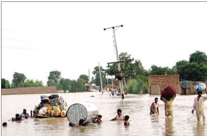
У Пакістане — найбольшая ў гісторыі паводка. Загінула 1500 чалавек, бедства закрнула мільён пакістанцаў.