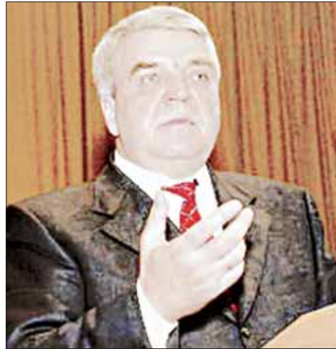
Бароўскі: з турмы — у дырэктары.

За Мальцавым беларускае войска пачало пазбаўляцца саветскай спадчыны. Больш строгай стала адказнасць за «дзедаўшчыну», па-