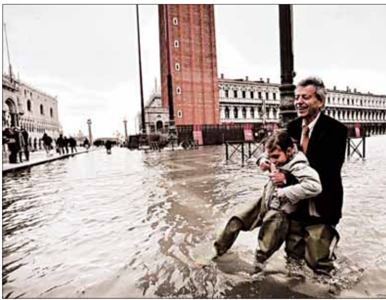
У Венецыі ў пачатку снежня — acqua alta , высокая вада. Прылівы ў Адрыятыцы ўзмацняюцца вятрамі сірока і борай і наганяюць ваду ў наганяўскую лагуну. Яе ўзровень дасягае сёлета 131 см, 70% горада затоплена. А люд не бядуе.