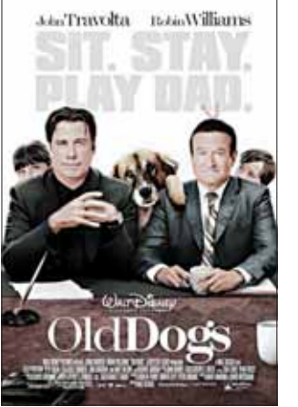
Так сабе каникулы (Old Dogs) ЗША, 2009, каляровы, 88 хв. Рэжысёр: Уолт Бекер Жанр: Камедыя Аздака: 4,5 (з 10)

Жывуць сабе два бізнэсоўцы-прадаглікі. Раптам аказваецца, што ў аднаго з іх ёсць дзеці. Ён іх ніколі не бачыў. Новапечаны бацька мушці пабыць з імі хоць два тыдні. Але ж тут наклеўваецца выгадны кантракт... Карціна пра «Старых сабаку», якая чамусьці перакладзена як «Каникулы» — камедыя натуэжлівых гэтаў на паўтары гадзіны. Прыціснуць дзверцамі машыны пальцы, падпалены скаўцікі лагер (навязліва называны «піянерскім»), офісныя звычкі, недарэчыня ў дзіцячай кампаніі, і механічна-электрычныя усмешкі.