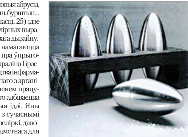
Алімпія Айкаіе. Прамысловы дызајн.