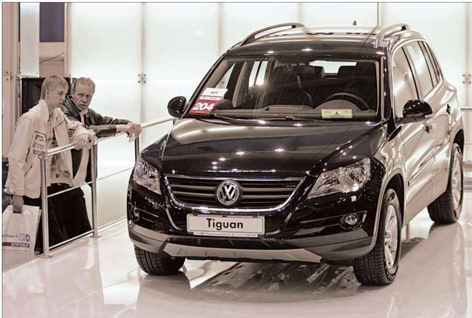
3 Новага года ў аўтасалоны беларусы будуць хадзіць, як у музей.

пейскіх машын з аўтавозаў. Мытны саюз ударыў не толькі па беларусах, але і па літоўцах. Шмат хто з іх жыў за кошт аўтавозаў і далейшага продажу машын у Расію і Беларусь.