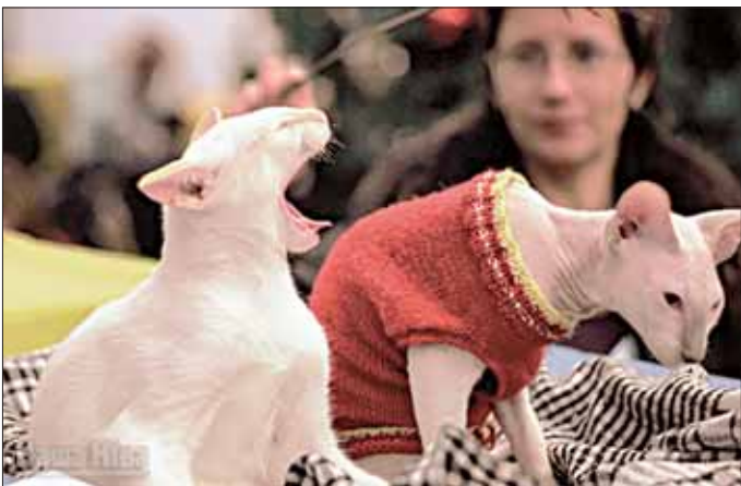
У Мінску прайшоў каціны з'езд: выстава «Найлепшы кот — 2009».